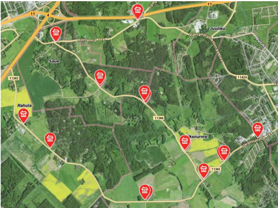
Joonis 1. Peatused Rahula, Saue ja Üksnurme külas

Bussipeatuste ligikaudsed asukohad olid tähistatud taotlusele lisatud Maa-ameti kaardil (väljavõtted Joonis 1 ja Joonis 2) ning taotluse kohaselt kavandatakse hajaasustusse ooteplatvormita ja -kojata peatusi, millele ehitatakse ooteala riigitee peenra laiendusena ja tähistatakse liiklusemärgiga 541a.